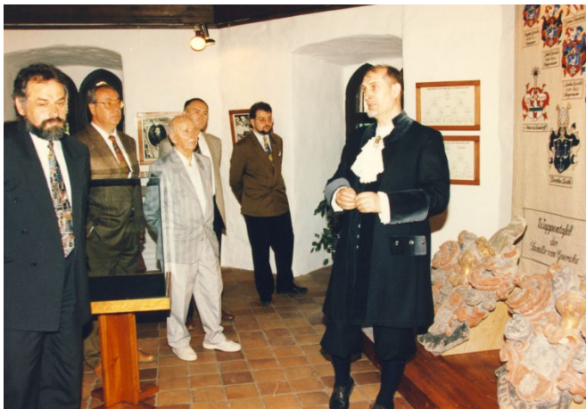
Bild von der Eröffnungsveranstaltung am 6. Mai 1995