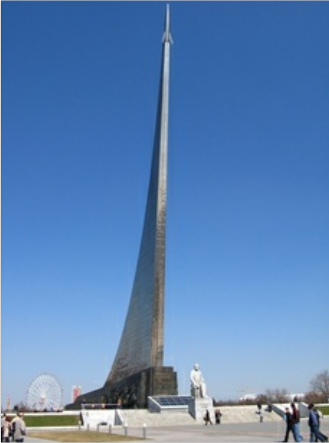
Spasskiturm, Moskauer Kreml ▶