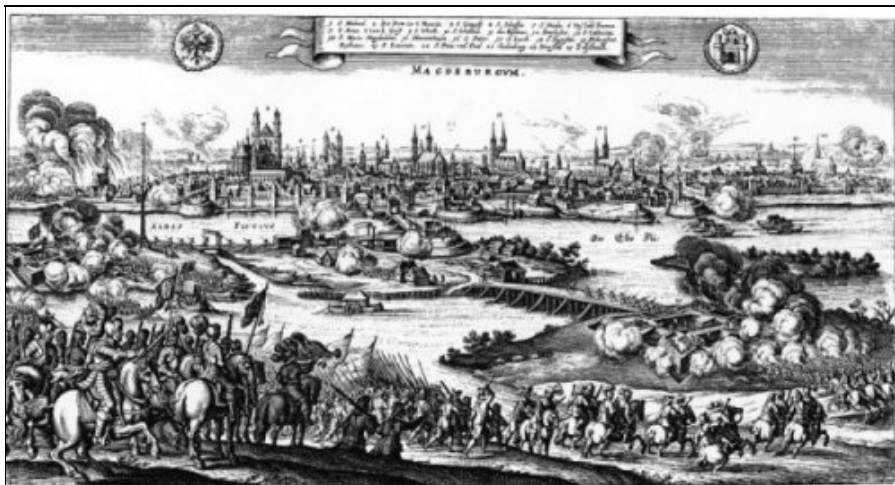
Sturm der Kaiserlichen auf Magdeburg, 1631

1631 belagerten die kaiserlichen Truppen wiederum Magdeburg. Gericke wurde zum Schutzherrn. Der Rat übertrug ihm die Verantwortung für Vorrat und Befestigung. Am 10. Mai drangen die Kaiserlichen unter Pappenheim am Neuen Werk (Fischeruf) in die Stadt ein und öffneten das Tor zur Hohen Pforte von innen. Eine furchtbare Plünderung, Brandschatzung und Verwüstung der Stadt begann. Auch der Schutzherr Otto Gericke und seine Familie gerieten in Gefangenschaft. Er konnte sich und seine Familie freikaufen und ging nach Braunschweig.