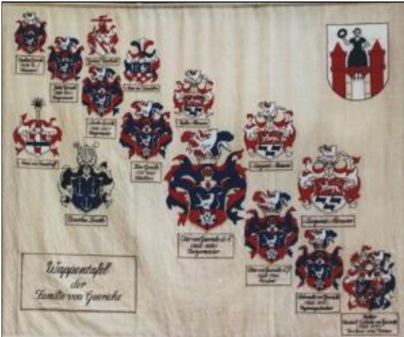
Applikation "Wappentafel der Familie Guericke", 1986, Gobelin