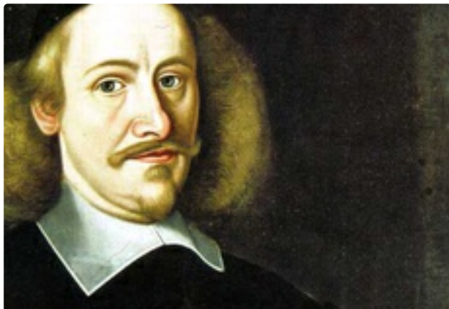
Otto von Guericke